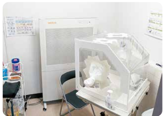
発熱外来検体採取室(室内Cタイプ)

医師への追加治療の有無を見極める必要があります。日頃からの観察力とコミュニケーション技術の重要性を改めて感じる貴重な時間となりました。そして何より、医師を含め他職種との連携が不可欠であり、チーム医療の大切さを実感しました。