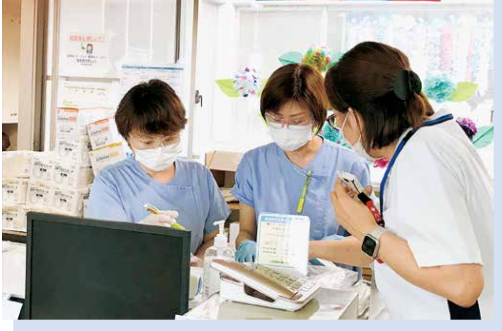
現在もコロナ対応に奔走中

コロナ感染流行前は、風邪症状や熱が出た時、気軽に病院を受診出来ていましたが今は出来ません。コロナにかかると隔離が必要となり、状態が悪化してもまずは保健所を通して診察できる病院を探してもらう必要があります。高熱が出て体力が消耗していく中、医療が逼迫することで受診先も見つからず、これからどうなるのだろうという恐怖の中で過ごすことは不安であったと思います。