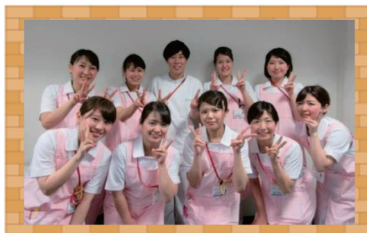
尼崎医療生協病院